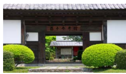
1977年陶芸家・濱田庄司が自身の80歳を記念し設立した美術館。作陶の糧として集めた世界の工芸品や濱田庄司の作品が、彼の住居とともに公開されています。展示館になっている建物は、すべて江戸末期から大正の民家を移築した後のコレクションの一部であり見所でもあります。一歩足を踏み入れると濱田ワールドが広がる空間です。

入場料 一般800円、中学生400円（20名以上大人700円、中学生300円） イベントバスポート1,000円 ※期間中フリーバスのバスポート